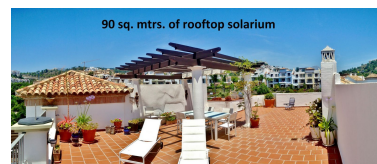
90 sq. mtrs. of rooftop solarium