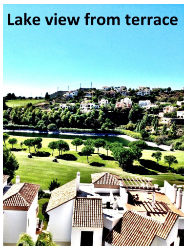
Lake view from terrace