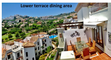
Lower terrace dining area