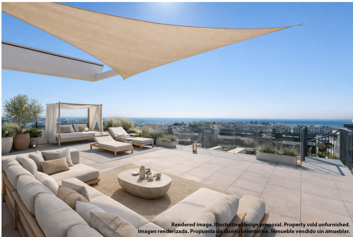
Rendered image. Illustrative design proposal. Property sold unfurnished. Imagen renderizada. Propuesta de diseño orientativa. Inmueble vendido sin amueblar.